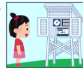
【図4】時ごと太陽の高さの関係